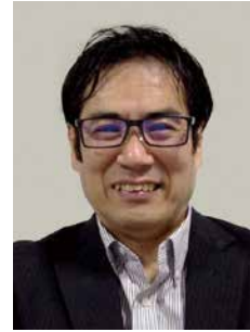
大山 雅嗣 Masatsugu OYAMA